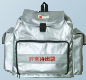
非常用給水リュック・1個