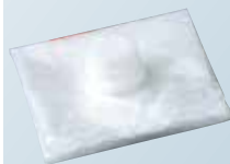
水運搬バッグ・1枚